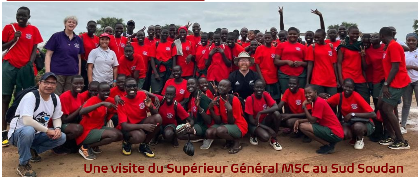
Une visite du Supérieur Général MSC au Sud Soudan