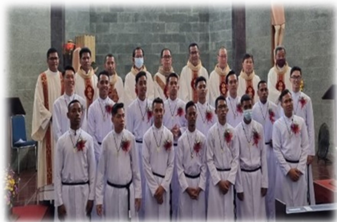
MASSE DE LA PREMIÈRE PROFESSION

En plus des visites aux districts, j'ai participé