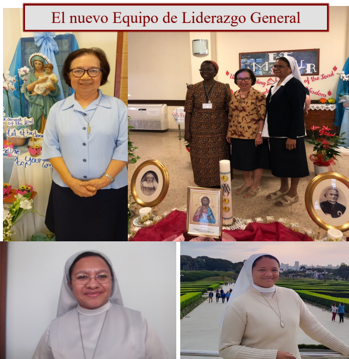
El nuevo Equipo de Liderazgo General

La primera fase del Capítulo consistió en reflexionar profundamente, utilizando el proceso de Sabiduría Comunitaria, sobre la vida de la congregación a través de los informes de la Provincia, el informe de Liderazgo Congregacional y otros documentos considerados en la fase preparatoria de este Capítulo. Las hermanas entraron en una escucha guiada por el Espíritu de las realidades y asuntos a considerar, refinando sus declaraciones en la oración, y proponiendo acciones para que el Capítulo las considere. Este trabajo se retomará y las