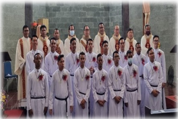
MISA DE LA PRIMERA PROFESION

Cuando visité el distrito de Java Central, donde está nuestra casa de noviciado, pude presidir la misa y, en nombre del Padre General, recibí los votos temporales de 15 novicios. El día anterior, el Provincial había recibido 25 nuevos novicios para el nuevo año de formación 2022-2023. Damos gracias a Dios porque hasta ahora los MSC seguimos recibiendo muchos candidatos.