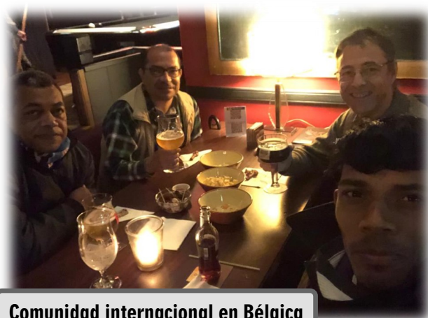
Comunidad internacional en Bélgica

Gracias a los cohermanos de la comunidad de Borgerhout por su acogida y testimonio misionero. Gracias también a los Laicos de la Familia Chevalier “Open Heart” por seguir haciendo vivo el Carisma MSC en diversos ambientes y espacios de vida.