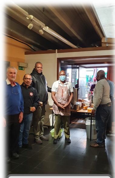
Trabajo con inmigrantes en el centro de Bruselas

recuerda a todos que la misión sigue viva, y que sigue vigente el llamado a ser el Corazón de Dios en la tierra.