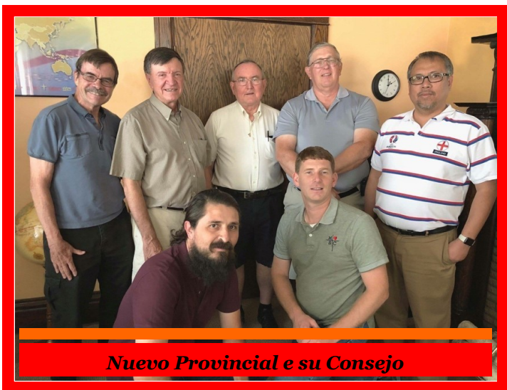
Nuevo Provincial e su Consejo

Del 18 al 22 de Junio se realizó dicho Capítulo, El ambiente y el desarrollo del mismo fue muy positivo. Una palabra que viene a mi corazón y mi mente para definir de alguna manera esta experiencia es "multiculturalidad", una nueva configuración del concepto de "Provincia MSC": Un grupo de misioneros de diferentes partes del mundo viviendo la misión y enfrentando sus desafíos en este multicultural territorio de