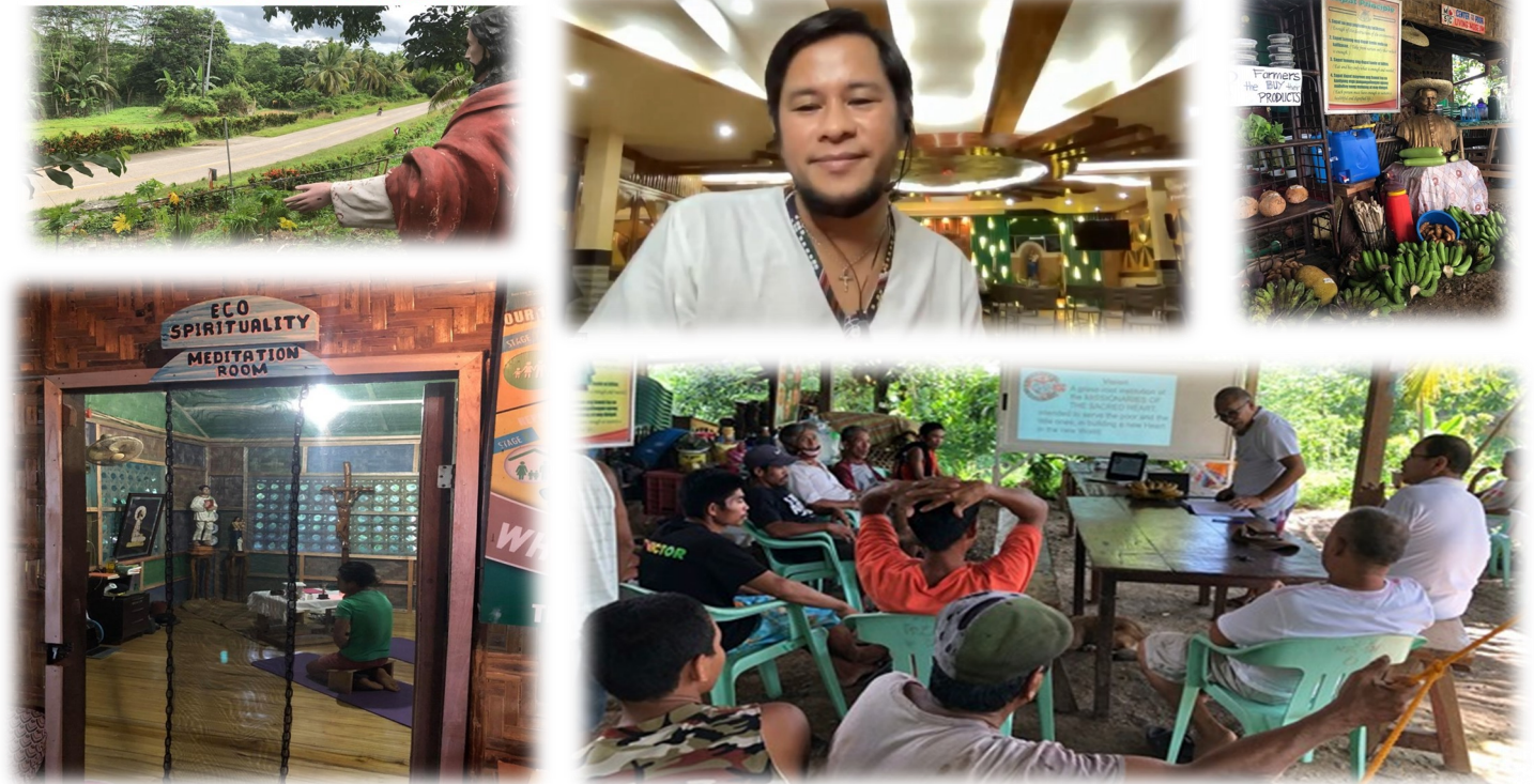
MSC CENTER FOR THE POOR – LIVING MUSEUM LAND MARK