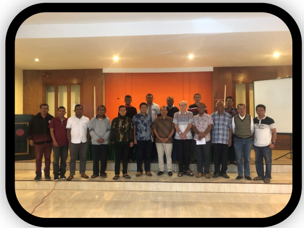
DISTRITO DE MALLUCAS

Cada Distrito tiene tantas fortalezas y riquezas especialmente en sus miembros que es imposible resumirlas en estas líneas escritas. Por supuesto hay grandes desafíos que cada persona y; por ende, cada Distrito MSC están llamados a enfrentar. Hay mucha vida que emerge desde dentro de cada co-hermano, desde dentro de las diferentes obras apostólicas y; sobre todo, desde dentro de cada Cultura. Pude experimentar de manera especial también la fuente de vida que emerge a través del testimonio de las hermanas y hermanos laicos. La