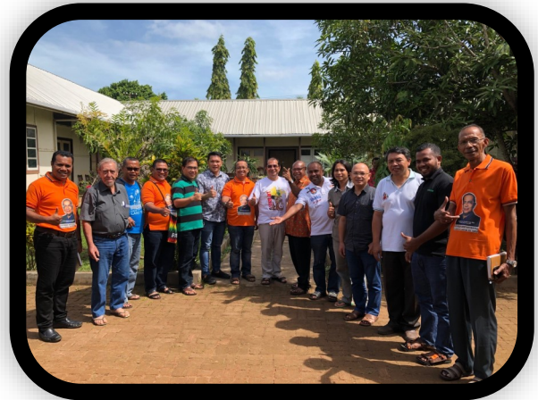
COMUNIDAD DE MARAOKE