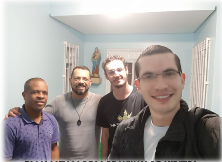
ESCOLASTICOS DE LA PROVINCIA DE CURITIBA

Me gustaría compartir con vosotros, hermanos, la maravilla de estar con nuestros formandos en la Provincia de Curitiba en julio y con los formandos de Vietnam en septiembre. Después del Encuentro de Formadores y Superiores del CA-MSC en São Paulo, fuimos a Curitiba. Actualmente, la Provincia de Curitiba tiene 2 formandos en Propedéutica, 8 en Pre-noviado, 1 en Noviciado y 4 en Post-noviado. Hablando con algunos de ellos, formal e informalmente, descubrimos los grandes sueños que traen en sus corazones y los dones que traen