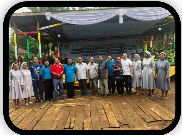
COMUNIDAD DE MENDIPTANA

Familia Chevalier está muy viva y en algunos lugares especialmente comprometida con la misión.