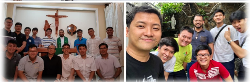
FORMANDOS DE VIETNAM